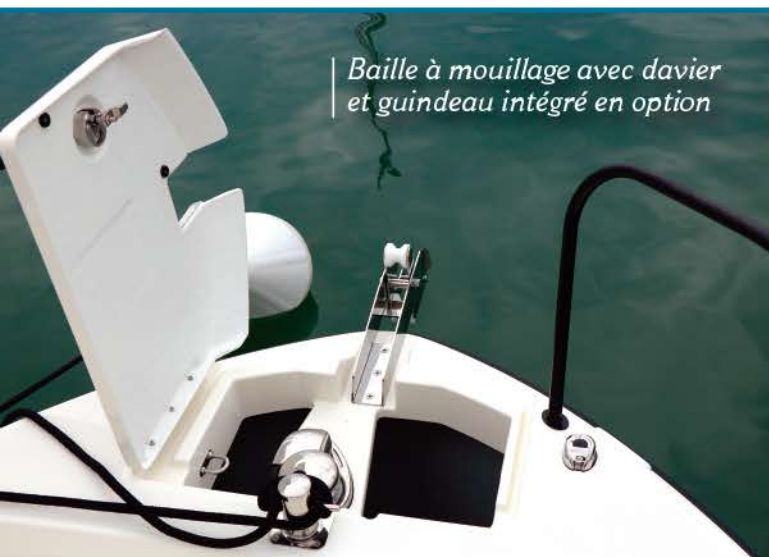
Baille à mouillage avec davier et guindeau intégré en option