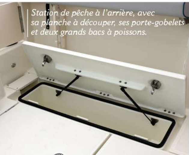
Station de pêche à l'arrière, avec sa planche à découper, ses porte-gobelets et deux grands bacs à poissons.

de conserver au mieux les appâts, ainsi qu'un tuyau de rinçage. Indispensables pour les pêcheurs, les porte-cannes ne manquent pas à bord sur les différents emplacements stratégiques, et le râtelier sur le hard-top de la cabine (en option) est très apprécié pour y ranger ses cannes. Même si elle peut être sportive, une partie