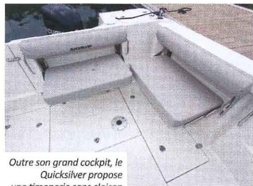
Outre son grand cockpit, le Quicksilver propose une timonerie sans cloison qui fait la part belle à l'espace et aux rangements.

Grâce à un passavant de 28 centimètres sur tribord et aux mains courantes, l'accès à la plage